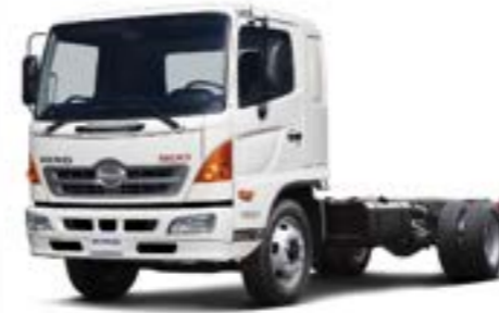
كابينه عادية Standard Cab

مجموعة متكاملة من شاحنات النقل المتوسطة بحمولة إجمالية تتراوح من 11.9 إلى 28 طن