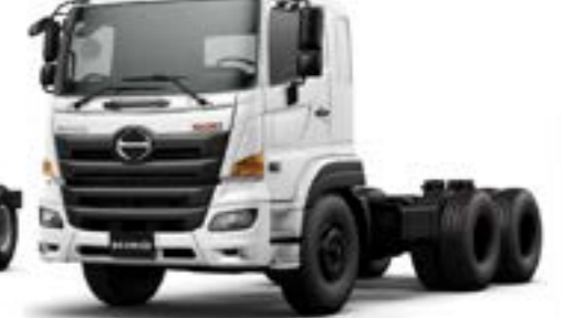
كابينه عريضة 6x4 Wide Cab

الهيكل والتجهيز إطار هيكل منسبك قوي ومثبت من غير مسامير. لتأمين كفاءة المصنعات المستخدمة لهيكل الشاحنة