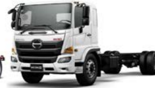
كابينه عريضة Wide Cab